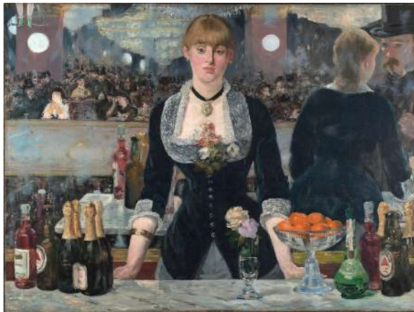
Édouard Manet, Un bar aux Folies Bergères , 1882 ; Institut Courtauld, Londres

par Monique Vanlaer , conférencière en histoire de l'art